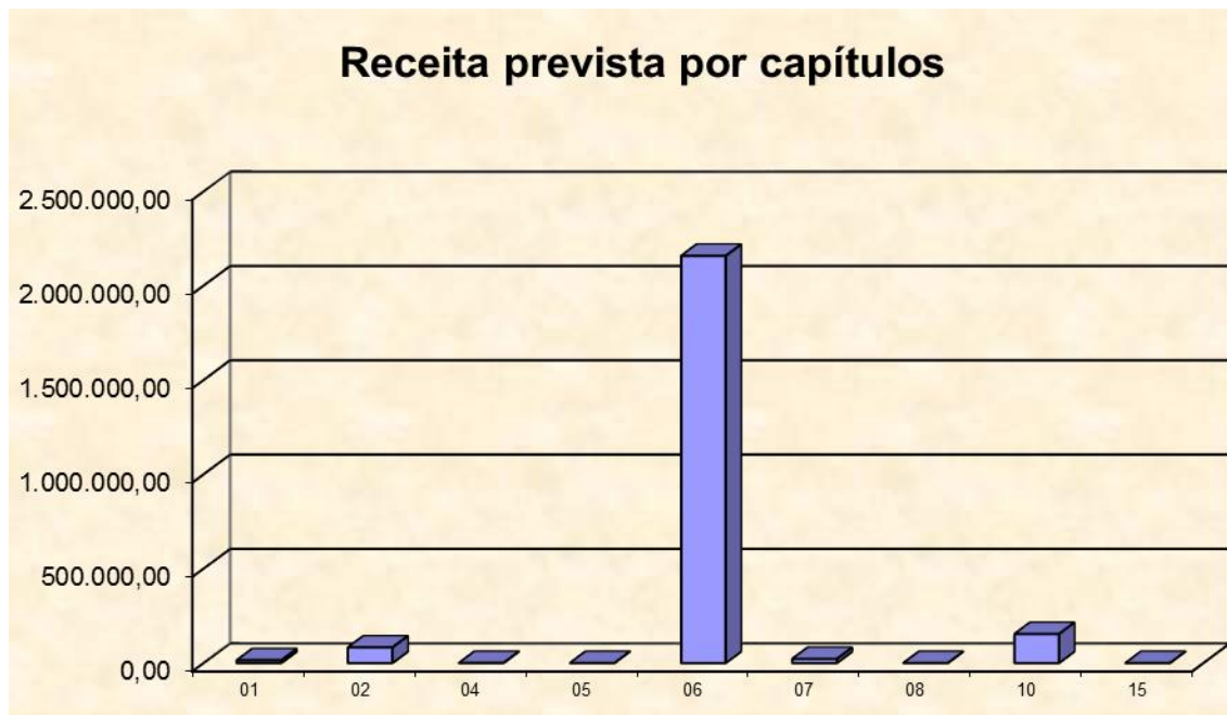
Gráfico n.º 1- receita prevista por capítulos